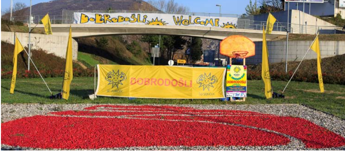
Sončkove zastave, transparenti, panoji dobrodošlice...

Nova Gorica pa je seveda center košarkarskega velemesta.